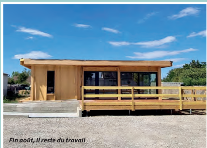
Fin août, il reste du travail

Ça y est presque, ou enfin, mais partiellement, ou pas encore, bref, on ne sait plus que dire sur ce qui aurait dû être une très belle idée. Après le rêve de la présentation d'une superbe maquette répondant à toutes nos exigences, nous sommes passés au cauchemar où trois grosses entreprises se livrent une guerre sans merci et où leur seul objectif est de récupérer de l'argent au mépris de toutes les règles des marchés publics, du client, des assistantes maternelles et des enfants. Au prix d'une quantité incommensurable d'efforts, de négociations, d'heures passées au suivi de chantier et de tentatives de négociation entre les belligérants, nous sommes parvenus à sauver une étape importante de ce chantier et obtenir la remise des clés. Certes, cela ne signifie pas la fin des travaux mais de très nombreuses remarques ont été consignées dans le procès-verbal.