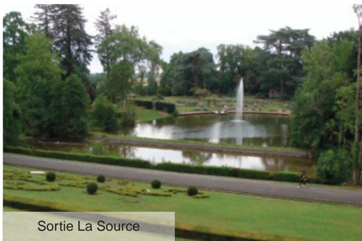
Sortie La Source