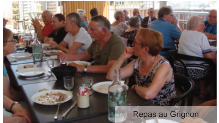
Repas au Grignon

Voici quelques manifestations de 2023 : 25 février