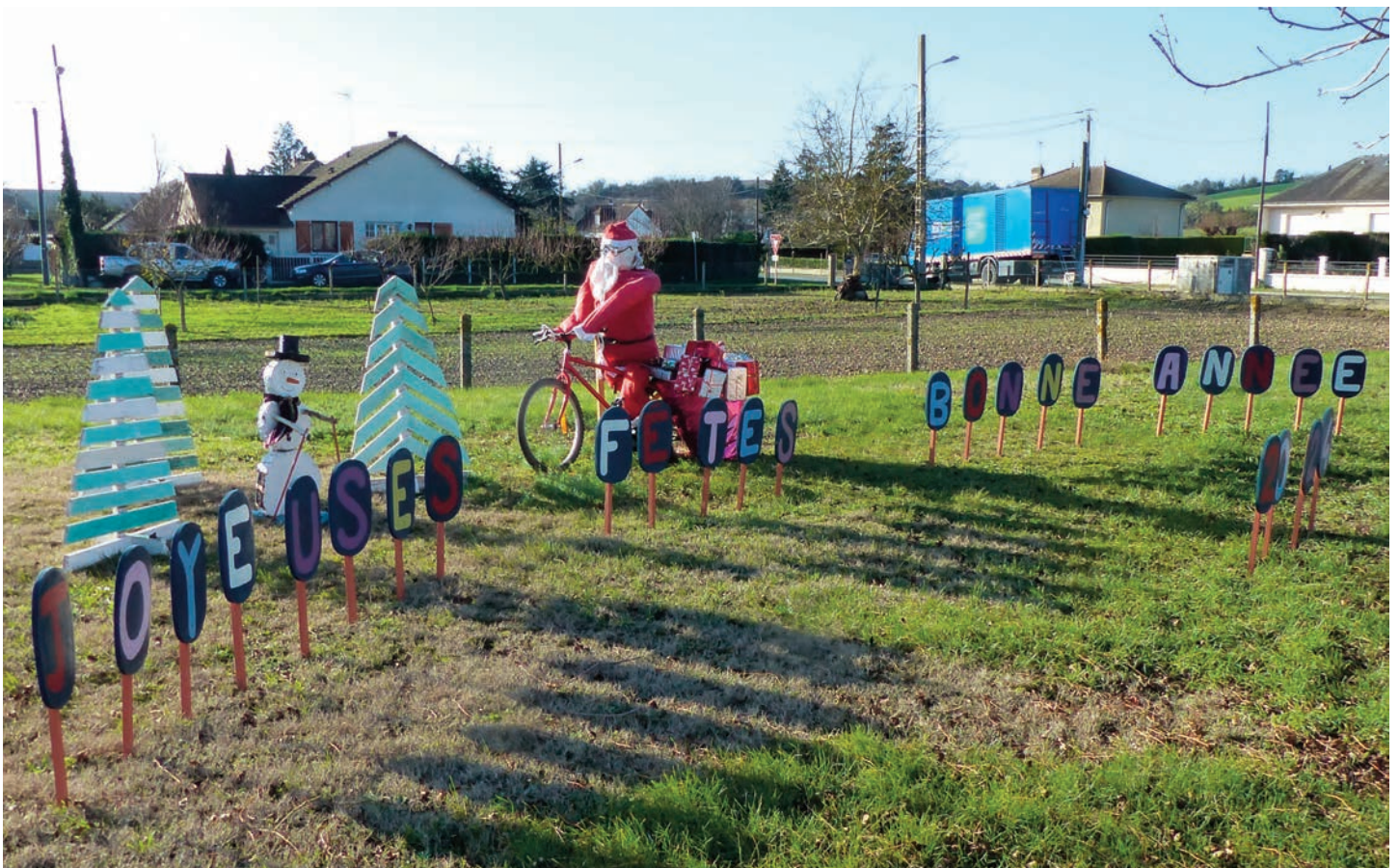
La Municipalité vous souhaite une bonne et heureuse année 2024.

Rédaction : Thierry BRUNET, Cédric AUBERTOT, Adeline FOUCTEAU-ESPINASSE, Brigitte GREMAT, Benoît VANDENDORPE