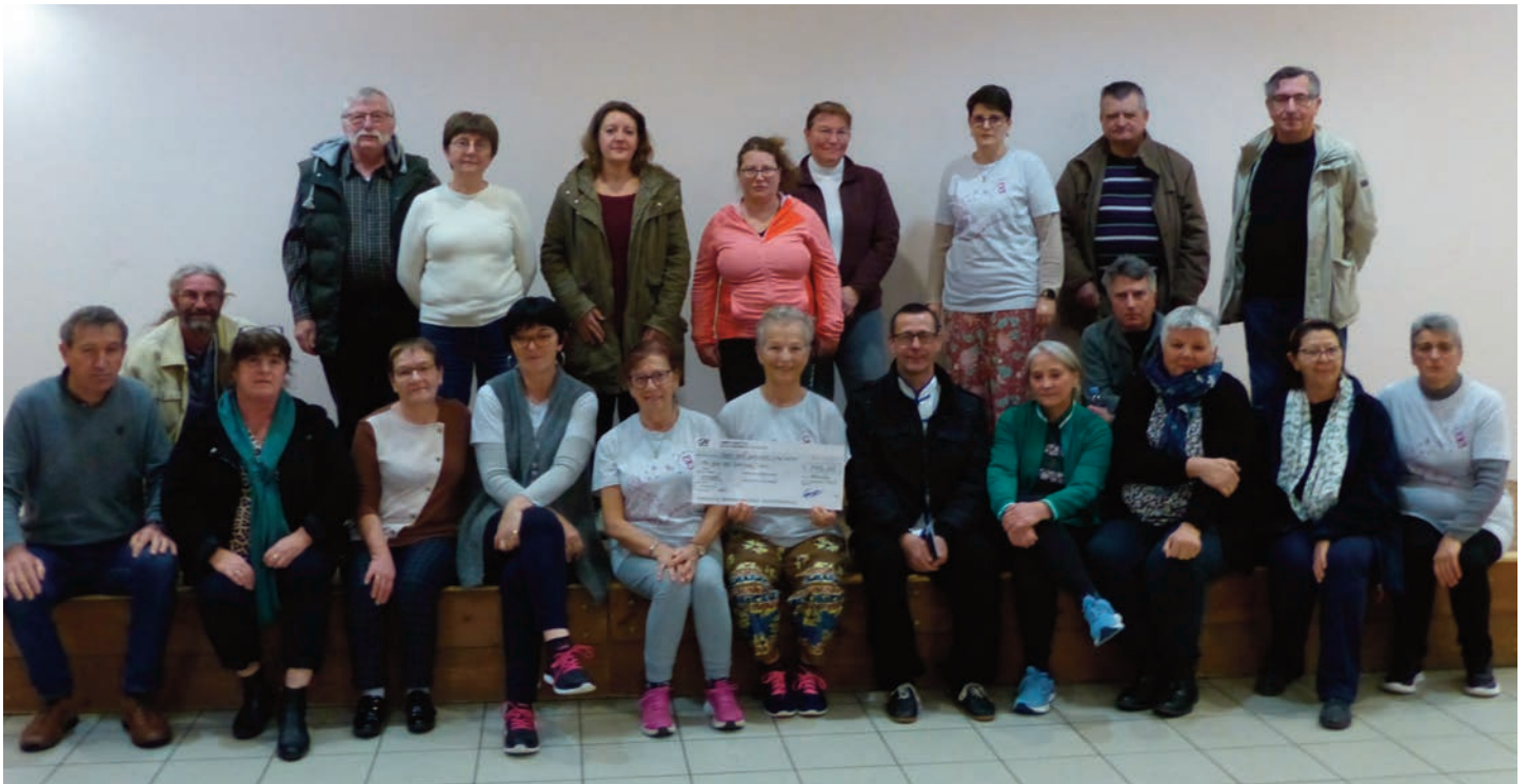
Gym Sourire et la Municipalité ont remis le jeudi 7 décembre le chèque de l'opération Octobre Rose à l'association "Au sein des femmes".