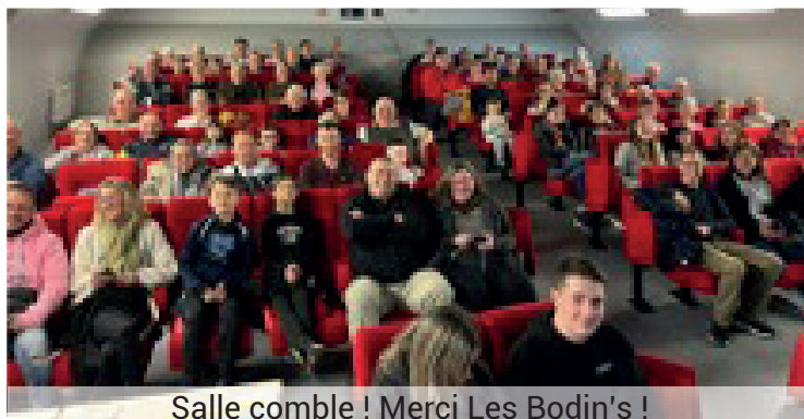
Salle comble ! Merci Les Bodin's !

Programmation disponible dans les commerces de Nouâtre et sur le site cine-off.fr . cinema.nouatre@gmail.com