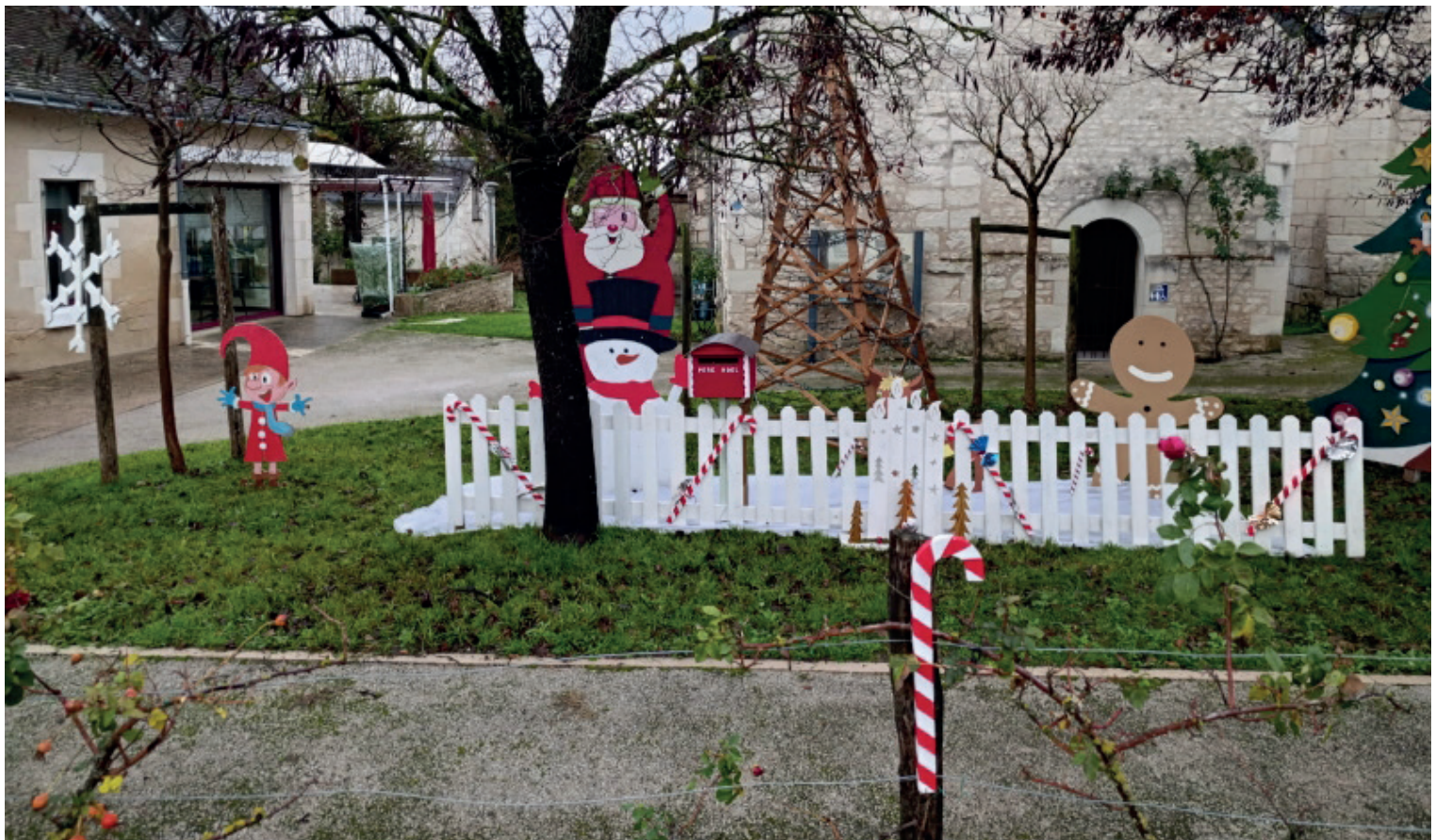
La Municipalité vous souhaite une bonne et heureuse année 2026.