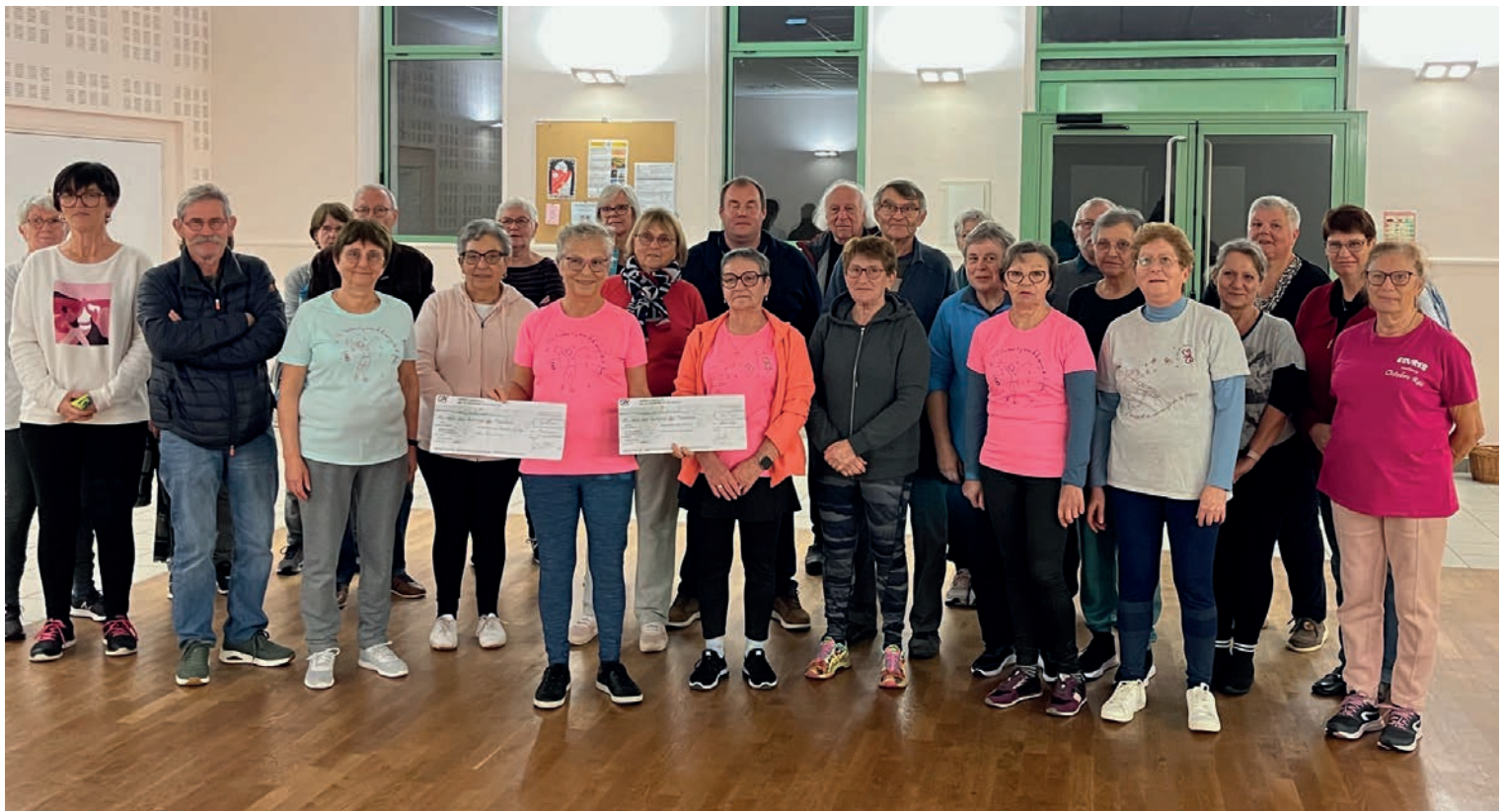
“Gym Sourire”, “les Pouzéens en fête” et la municipalité ont remis le lundi 2 décembre le chèque de l’opération Octobre Rose à l’association « Au sein des femmes ».